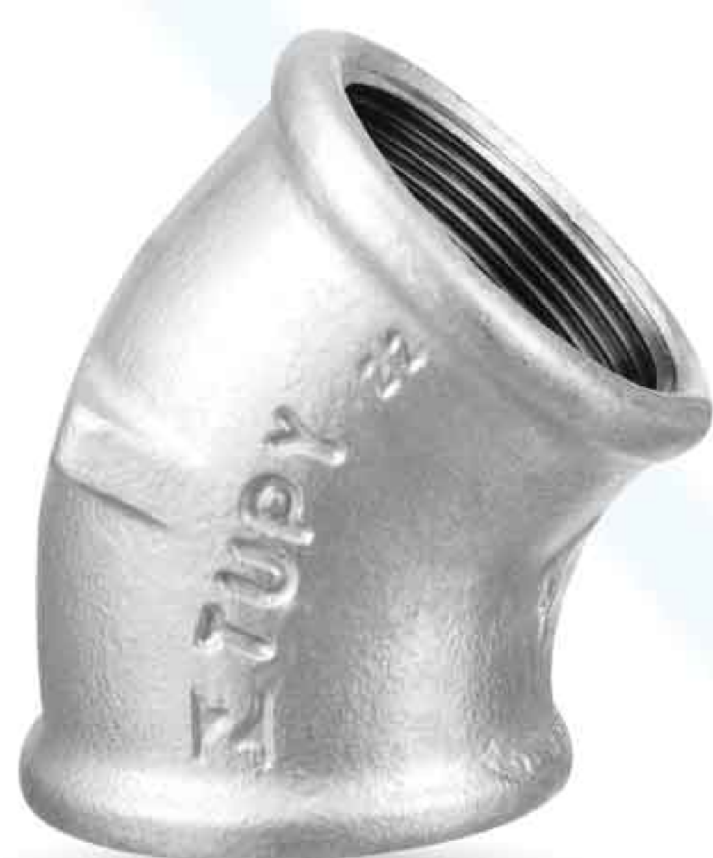
چپقی ۴۵ درجه 45° ELBOW