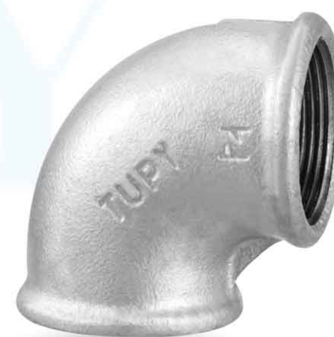
زانو تبدیلی ELBOW REDUCING